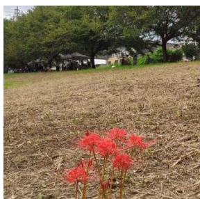
ヒガンバナも 咲き始めていた