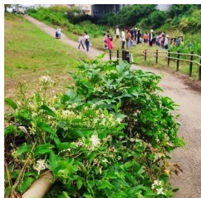
日本のクレマチス センニンソウ